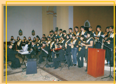
Coro de la Pontificia Universidad Católica del Perú - PUCP.