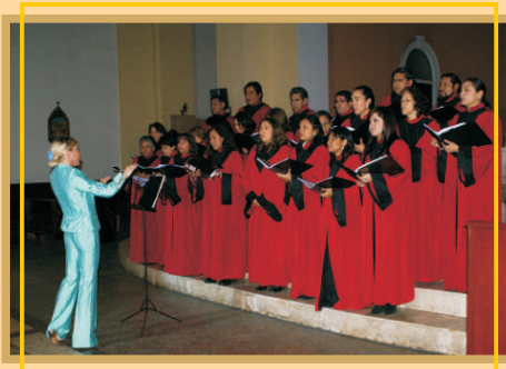
Coro de la Alianza Francesa.